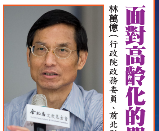
林萬德 (行政院政務委員、前北縣副縣長)