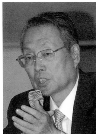
◆施振榮/智融集團董事長