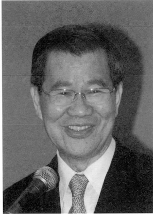
◆蕭萬長 / 中華民國副總統