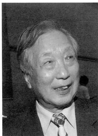
◆孫震/台大經濟系教授