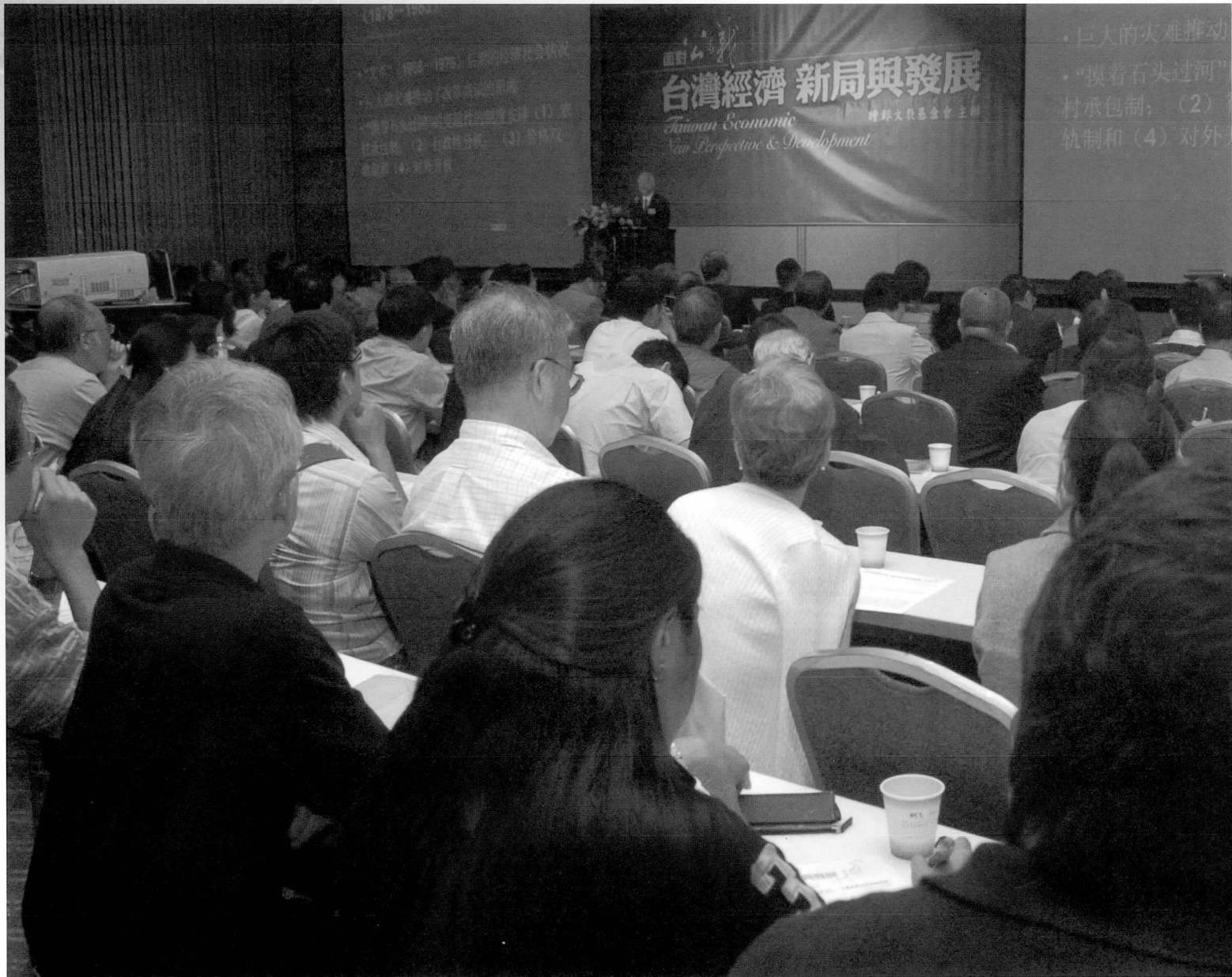
◆台灣經濟新局與發展邀請北大教授吳敬璉進行專題演講。

全球經濟快速變動，舊的經濟秩序瀕臨瓦解，新的經濟強權版圖不斷重組，台灣近年與亞洲經濟互動趨於被動，與全球經濟變遷缺乏對應，加上內部資源自我消耗，所承受嚴峻考驗。