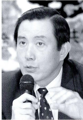
◆台北市市長馬英九。