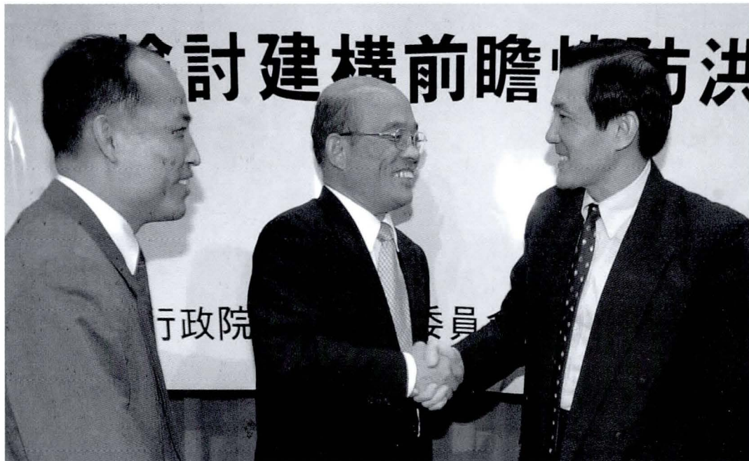
◆台北市市長馬英九與台北縣縣長蘇貞昌願意攜手合作共同防颶。

這麼多年來，每次台灣遇到災難，時報文教基金會總會在河川保護小組召集人的呼籲下挺身而出，試圖為台灣問診，找出台灣受創的原因，但這一次不用我們多費口舌，全國感同身受的同胞都在吶喊——「台灣到底出了什麼問題？」