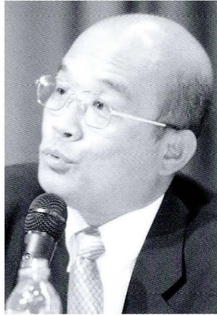
◆台北縣縣長蘇貞昌。