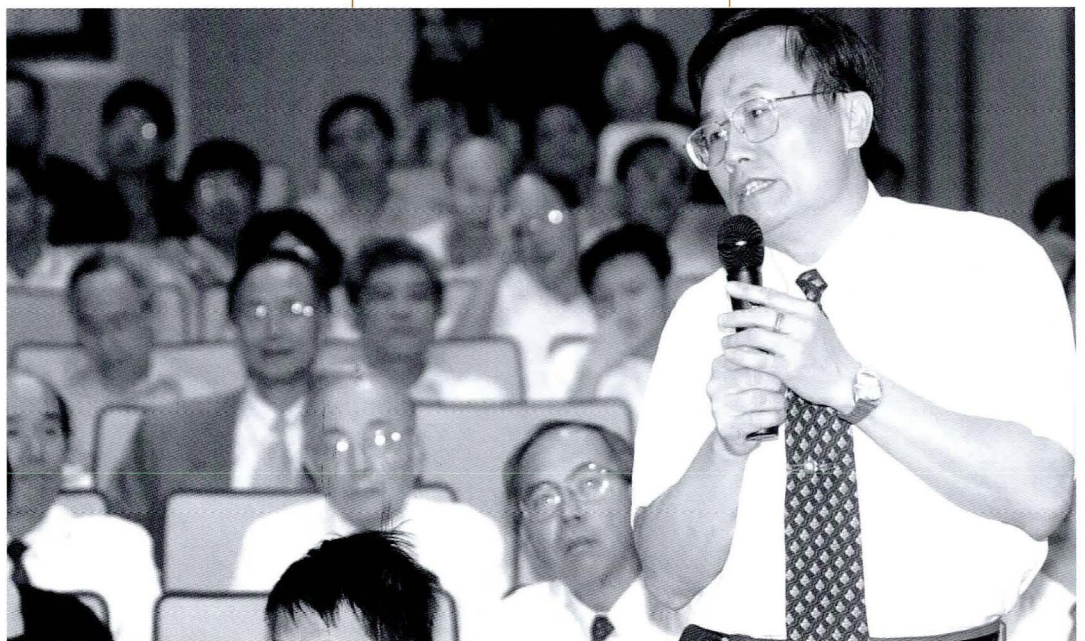
◆與會人士踴躍發言。