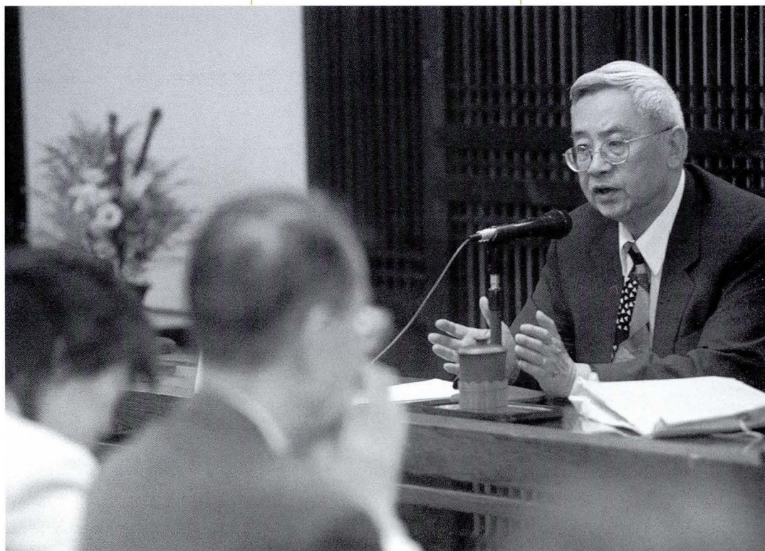
◆中研院院士余英時強調經濟發展與人文關懷同時並進。