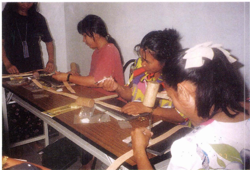
● 文化傳承研習班在東清部落進行的皮雕班。