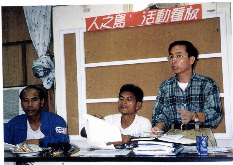
● 社區總體營造座談會是凝聚共識的開始。

但由於清楚知道「不要什麼」的共識，至少要什麼的答案的追尋，就不會如此困難重重。這也是蘭嶼希望的所在。