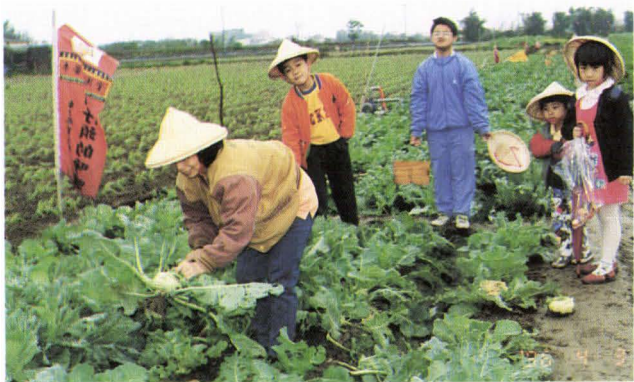
◆ 休閒農業是台灣農業轉型的方向。

謝敏政認為休閒農業是台灣農業轉型的方向，藝術村原是汐止鎮的構想，可惜用地被中央研究院長李遠哲看上，將作為研究院分院，藝術村沒有辦法在汐止鎮生存，水返腳藝文中心高燈立肯定船仔頭可以發展為休閒藝術村；也就這樣，「船仔頭休閒藝術村」的概念在大家的心中