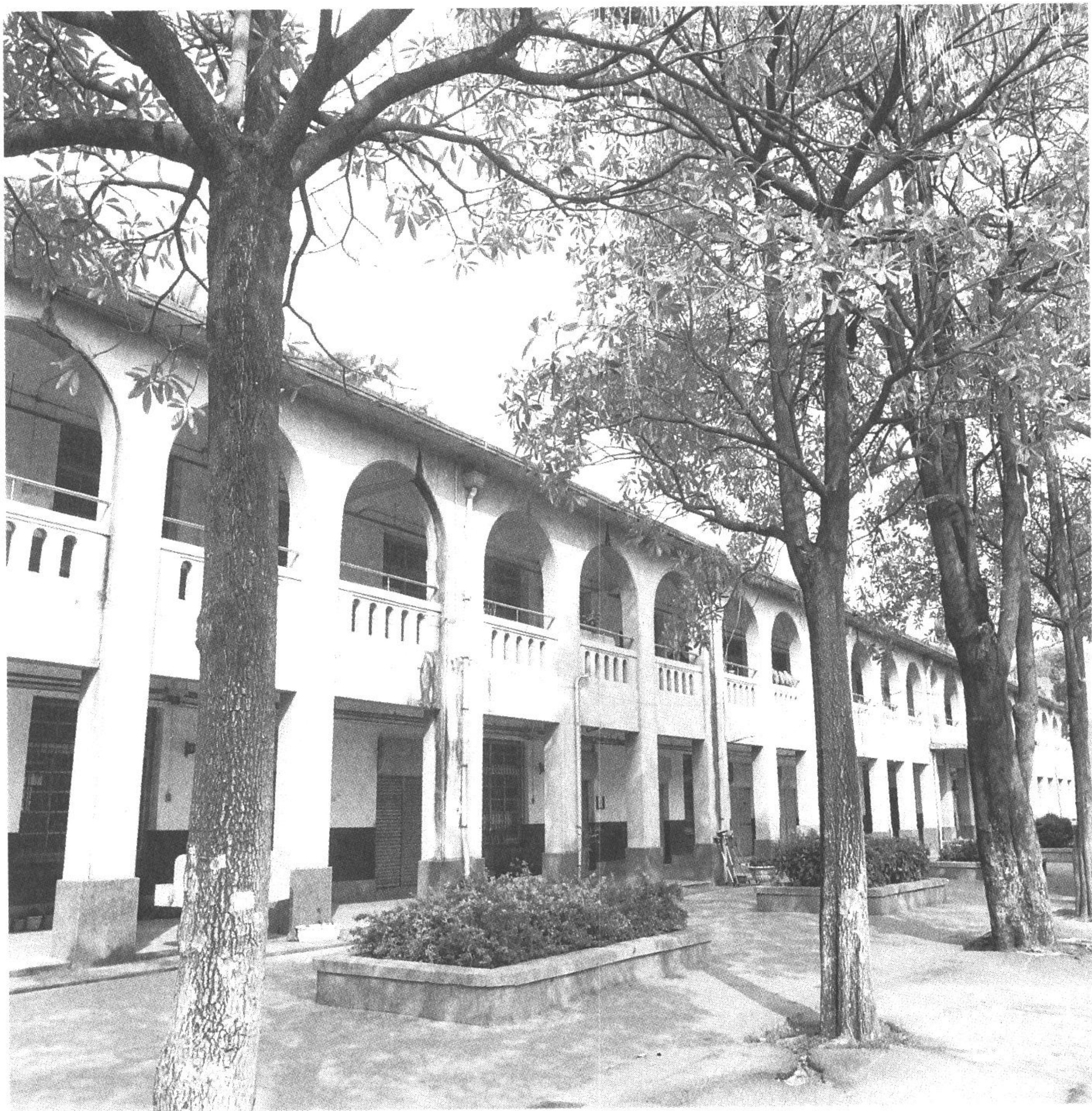
◆中山國小北棟教室，其連拱形立面為羅馬圓拱式走廊，為彰化縣十大歷史建築之一。（攝於彰化市）