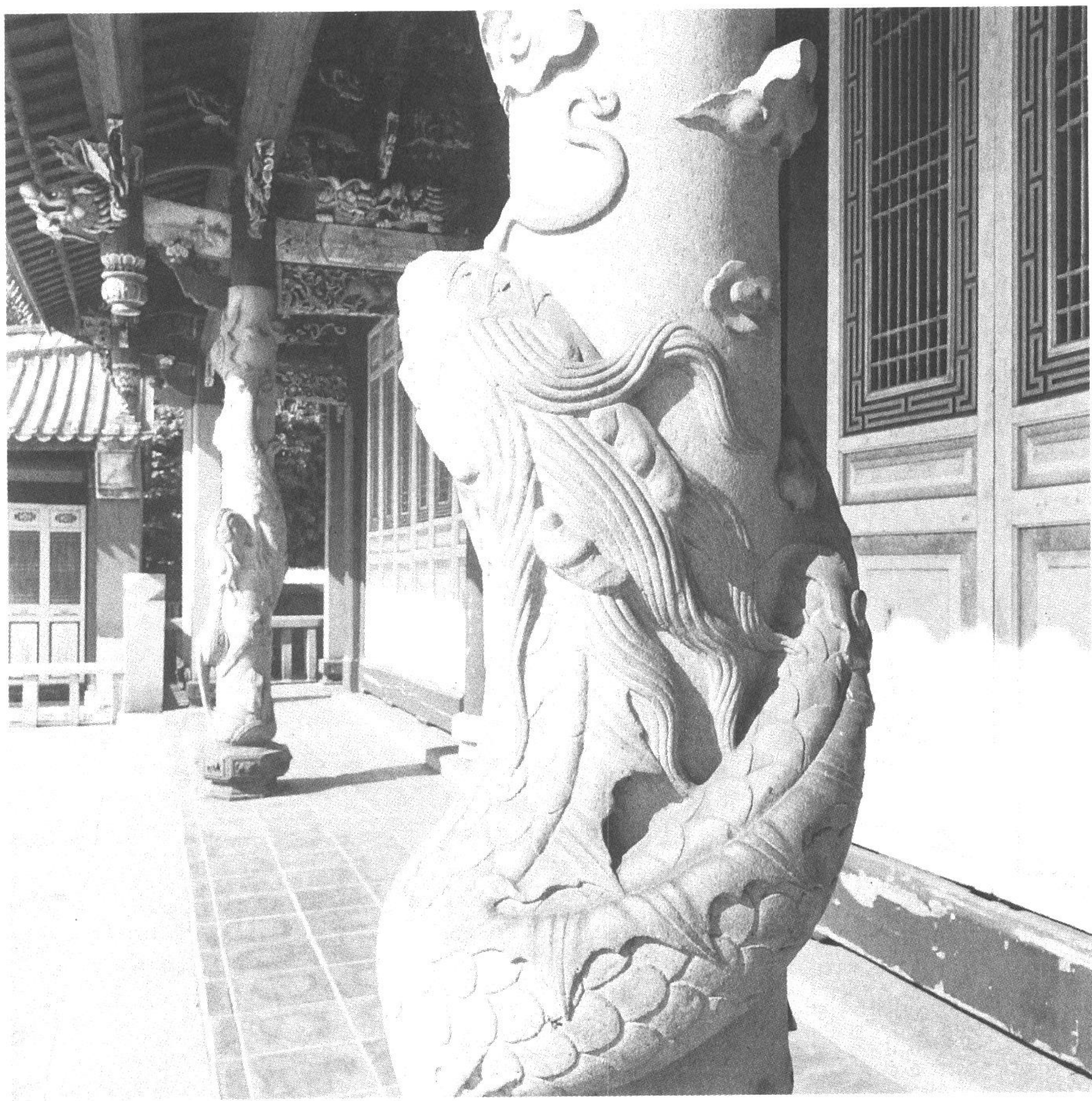
◆孔子廟大成殿有露台與石欄杆，門前石雕蟠龍柱一對，氣勢恢宏。（攝於彰化市）