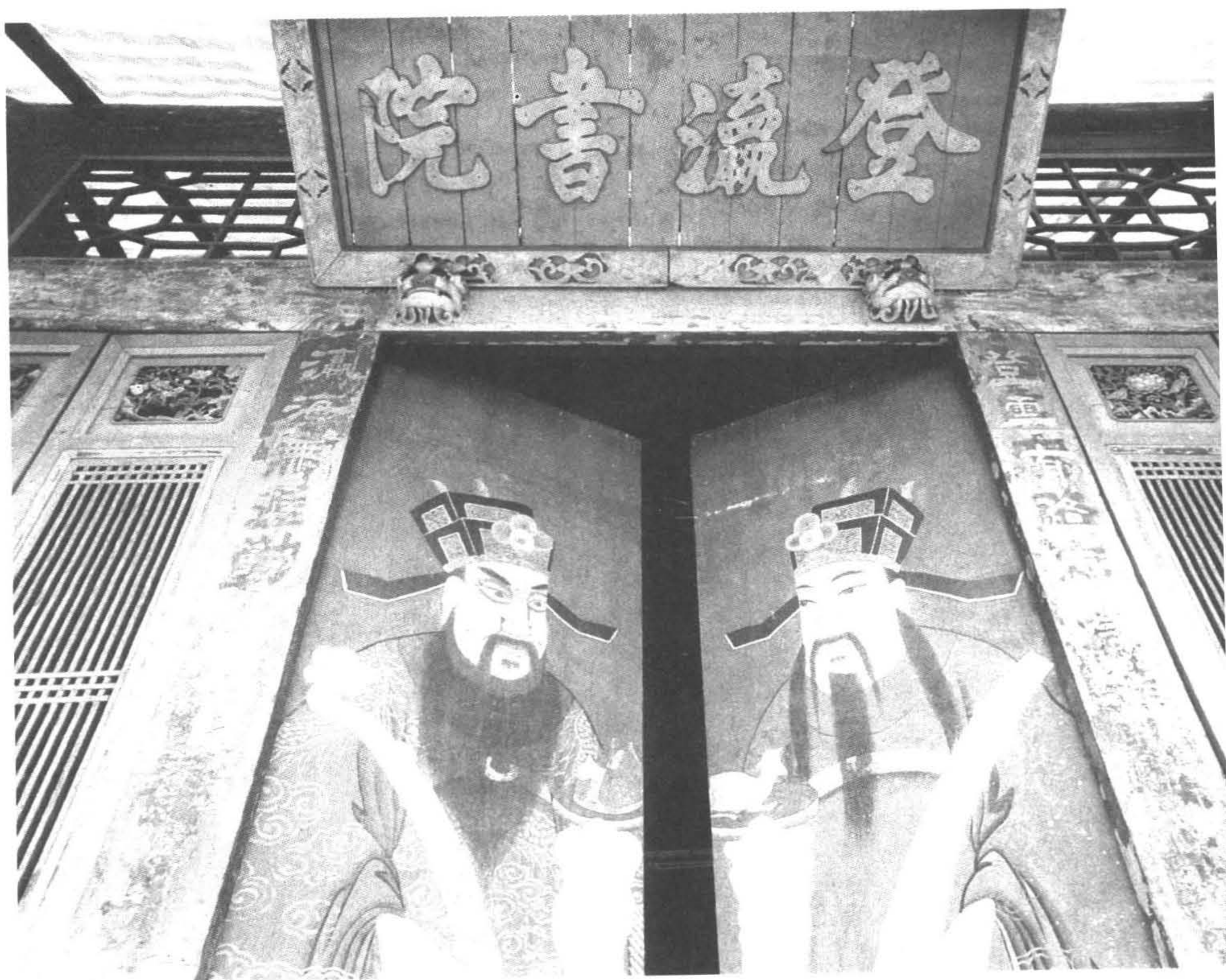
◆登瀛書院為單進兩翼齋舍的傳統建築。（攝於南投縣草屯鎮）