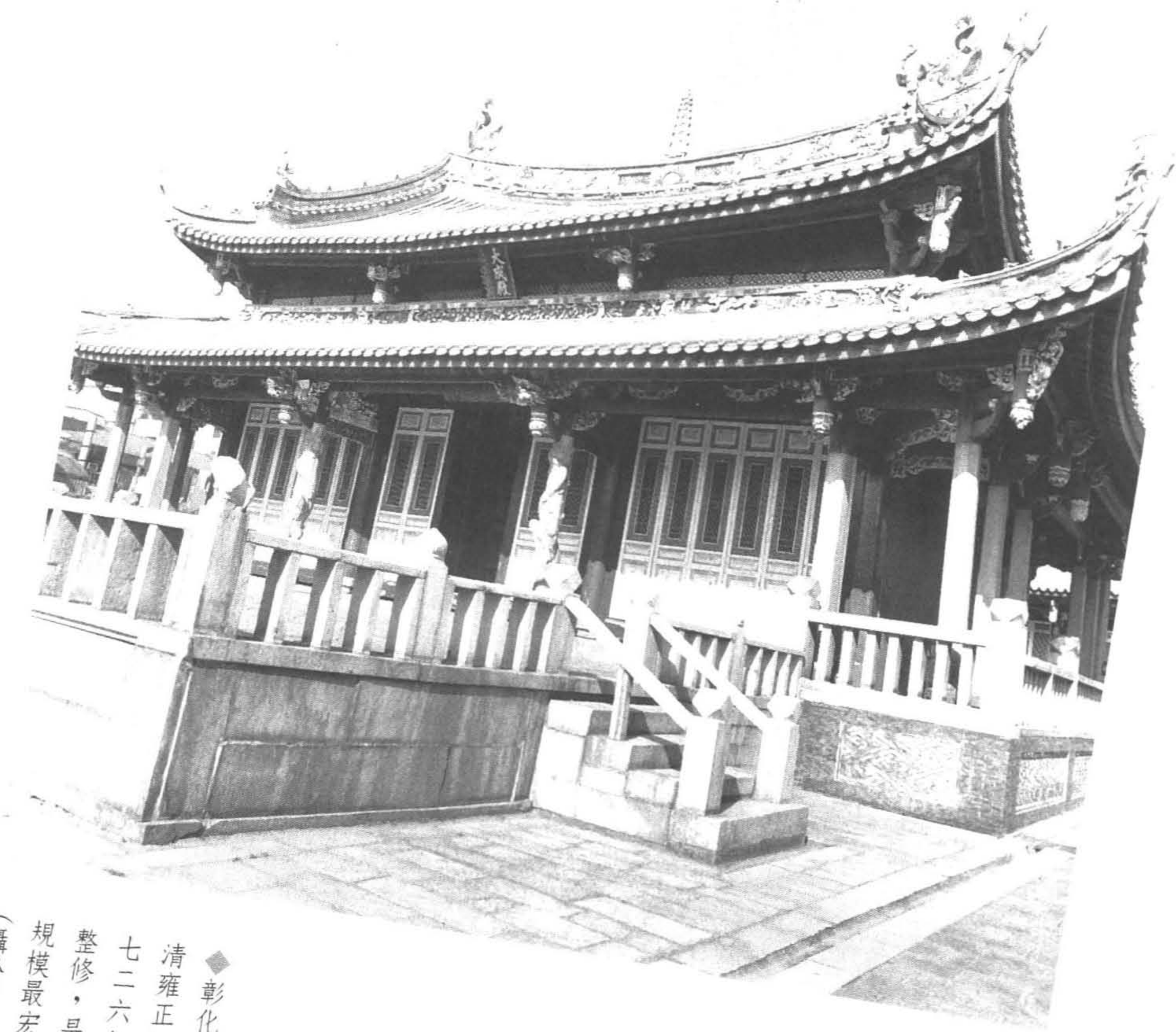
◆彰化孔子廟始建於 清雍正四年（西元一 七二六年），經多次 整修，是台灣儒學中 規模最宏大的建築。 （攝於彰化市）