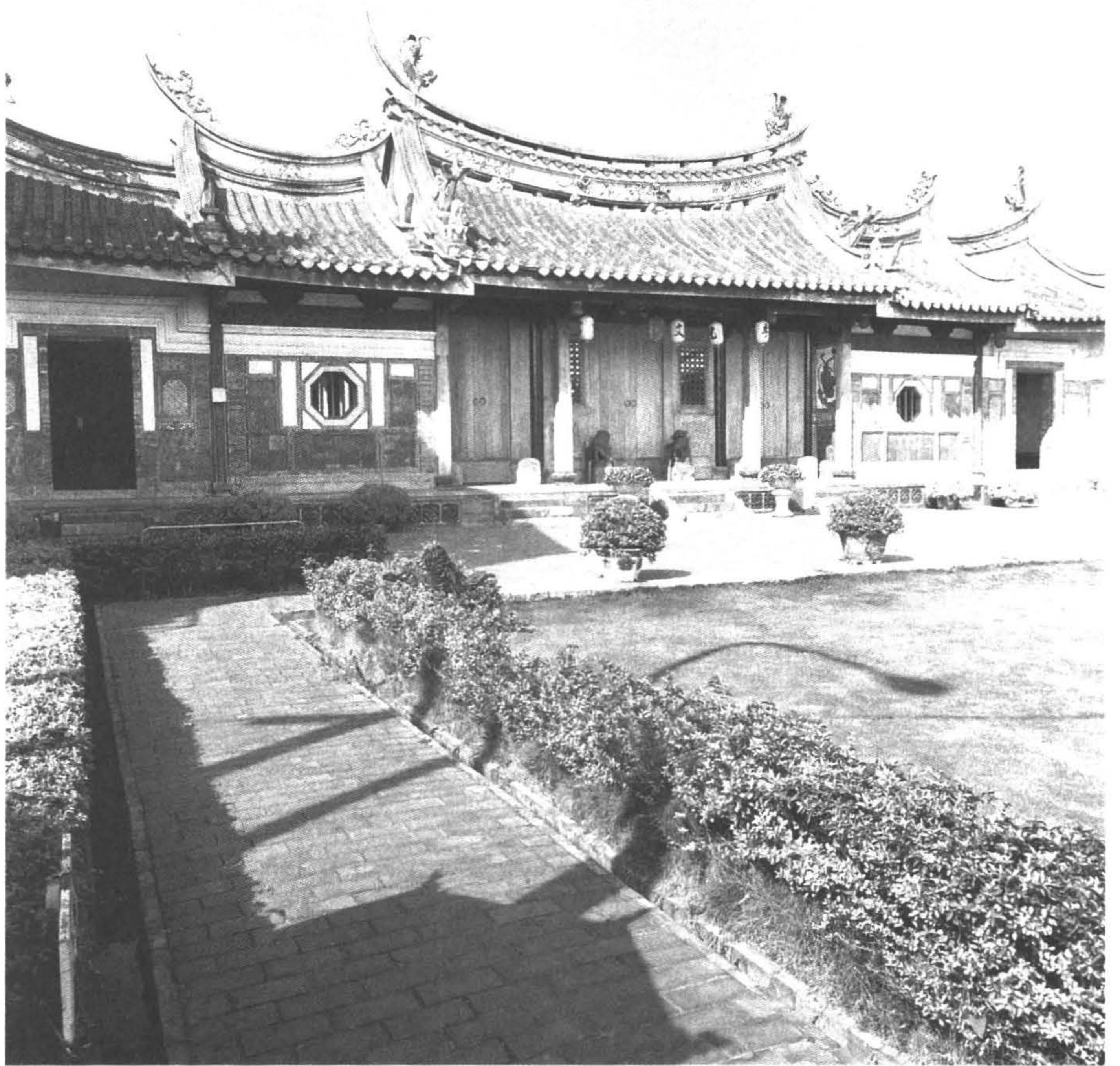
◆ 磺溪書院是中軸對稱兩進護龍平面閩式建築，飛揚的三川燕尾脊與層層疊降的屋面，鋪陳廣達七開間的立面。（攝於台中縣大肚鄉）