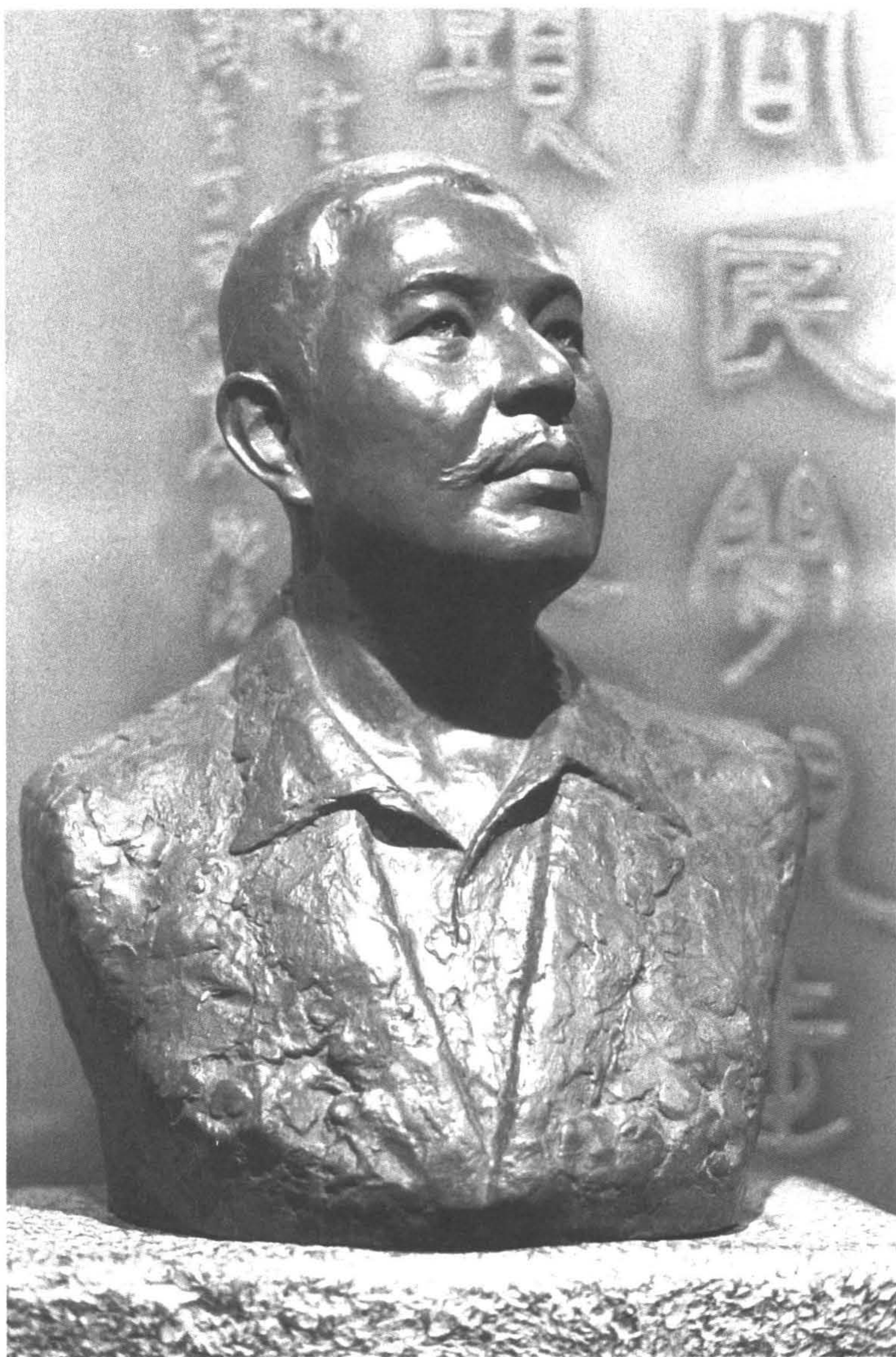
◆「台灣新文學之父」賴和先生的銅像。（攝於彰化市）