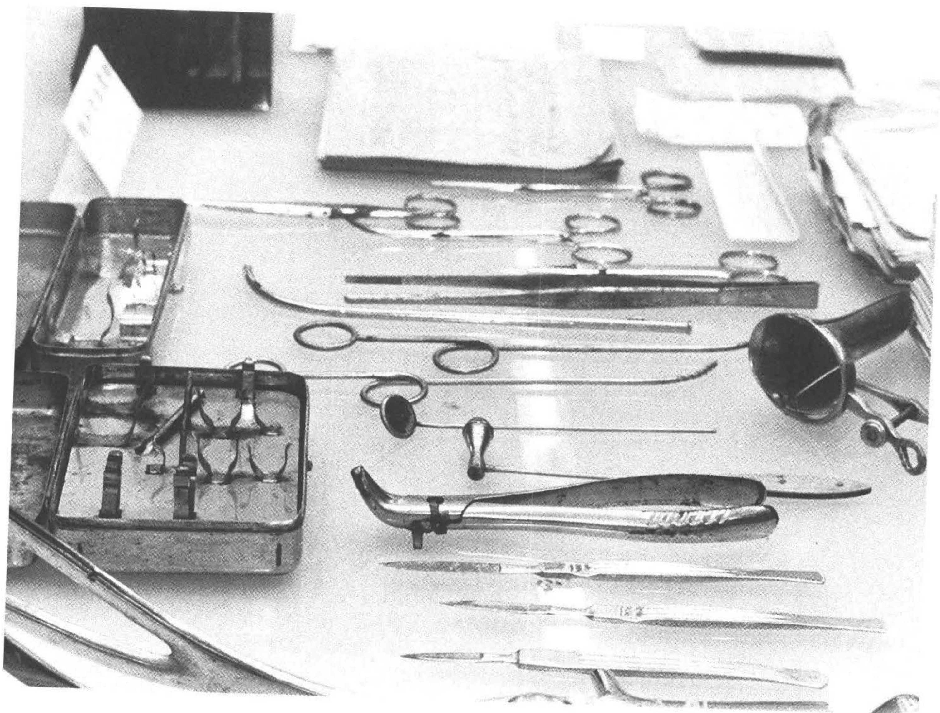
◆賴和紀念館仍保存賴和先生多樣醫療器具。(攝於彰化市)