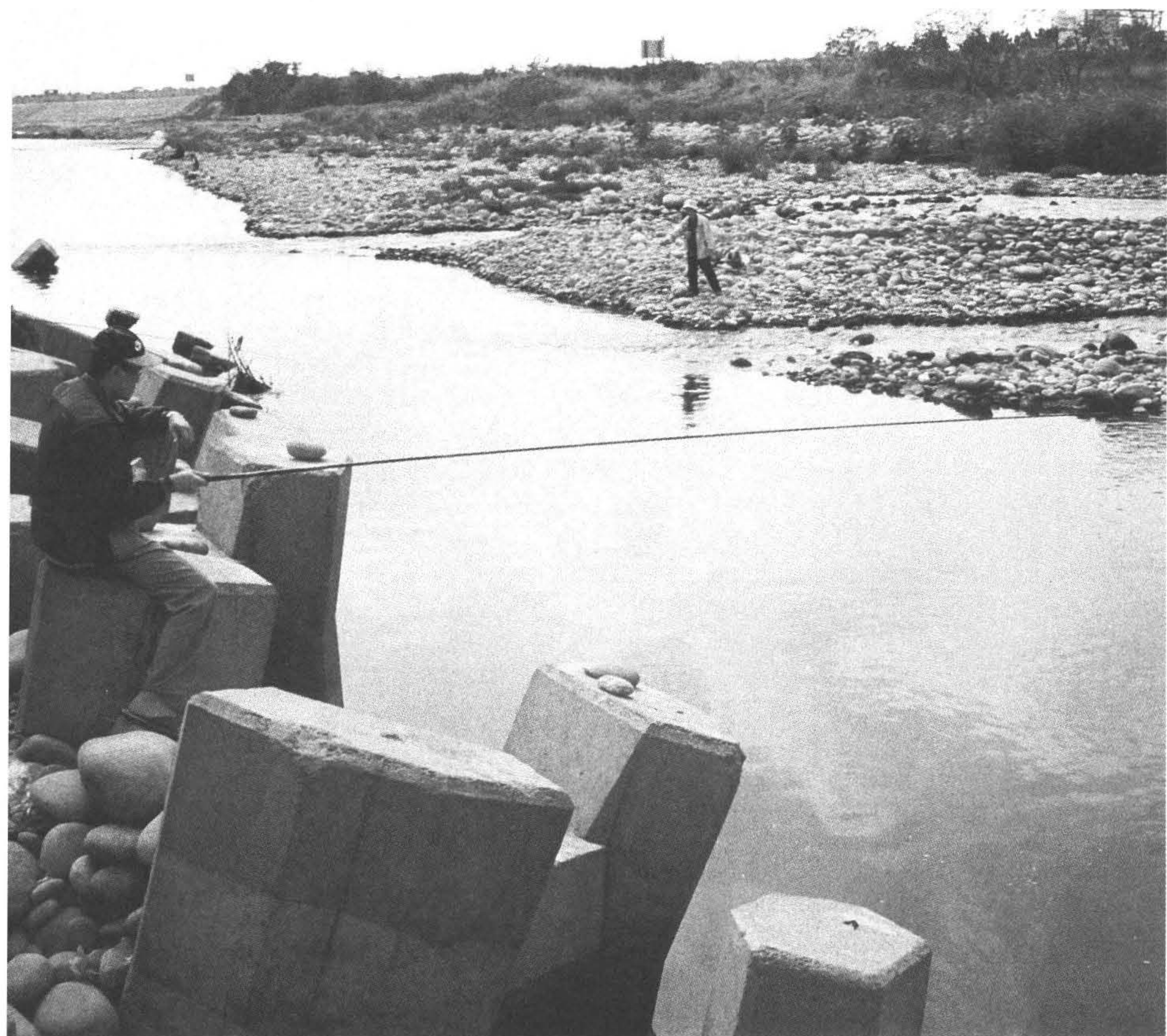
◆筏子溪橋下如今仍可見 垂釣者樂在其中。（攝於 台中市南屯區）