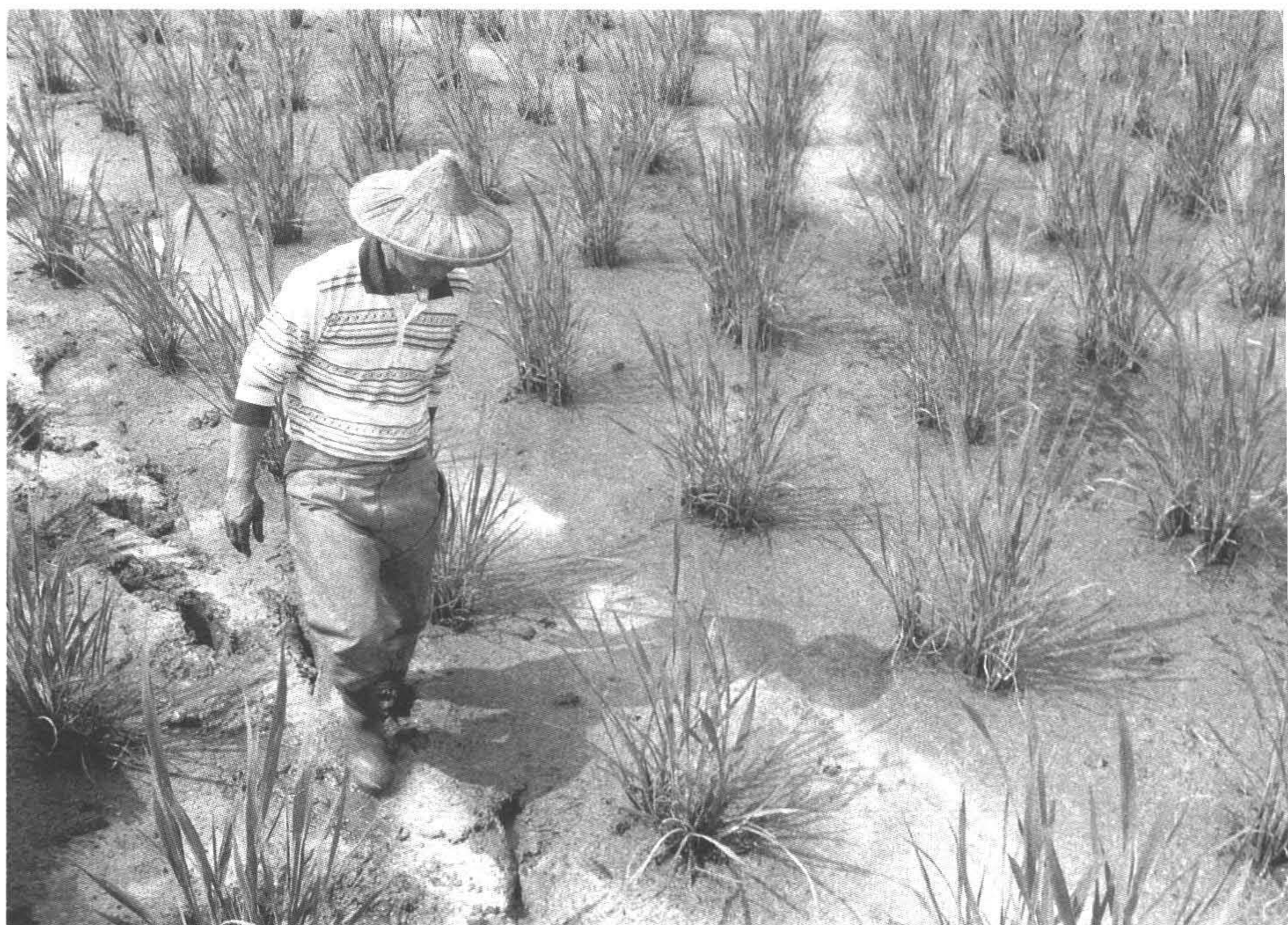
◆埔里盆地因兩條河川流經，提供豐富的灌溉水源以利耕作。（攝於南投縣埔里鎮）