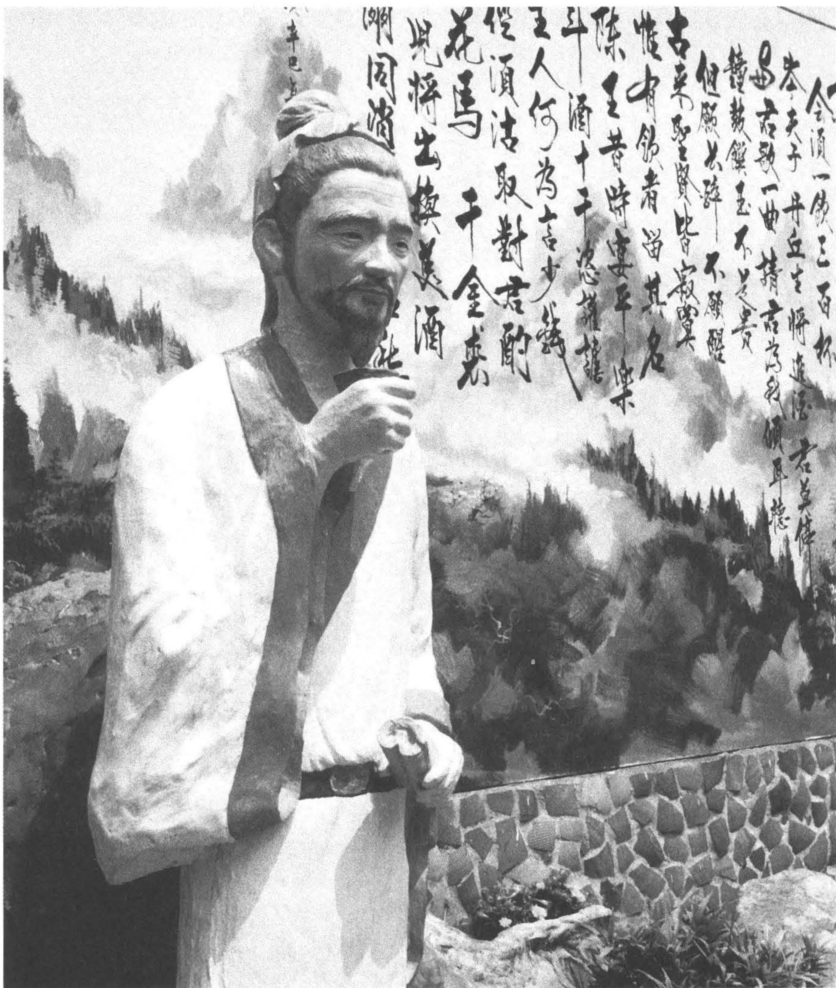
◆埔里酒廠以酷愛飲酒的詩仙李白為「酒文化」的代言人。 (攝於南投縣埔里鎮)