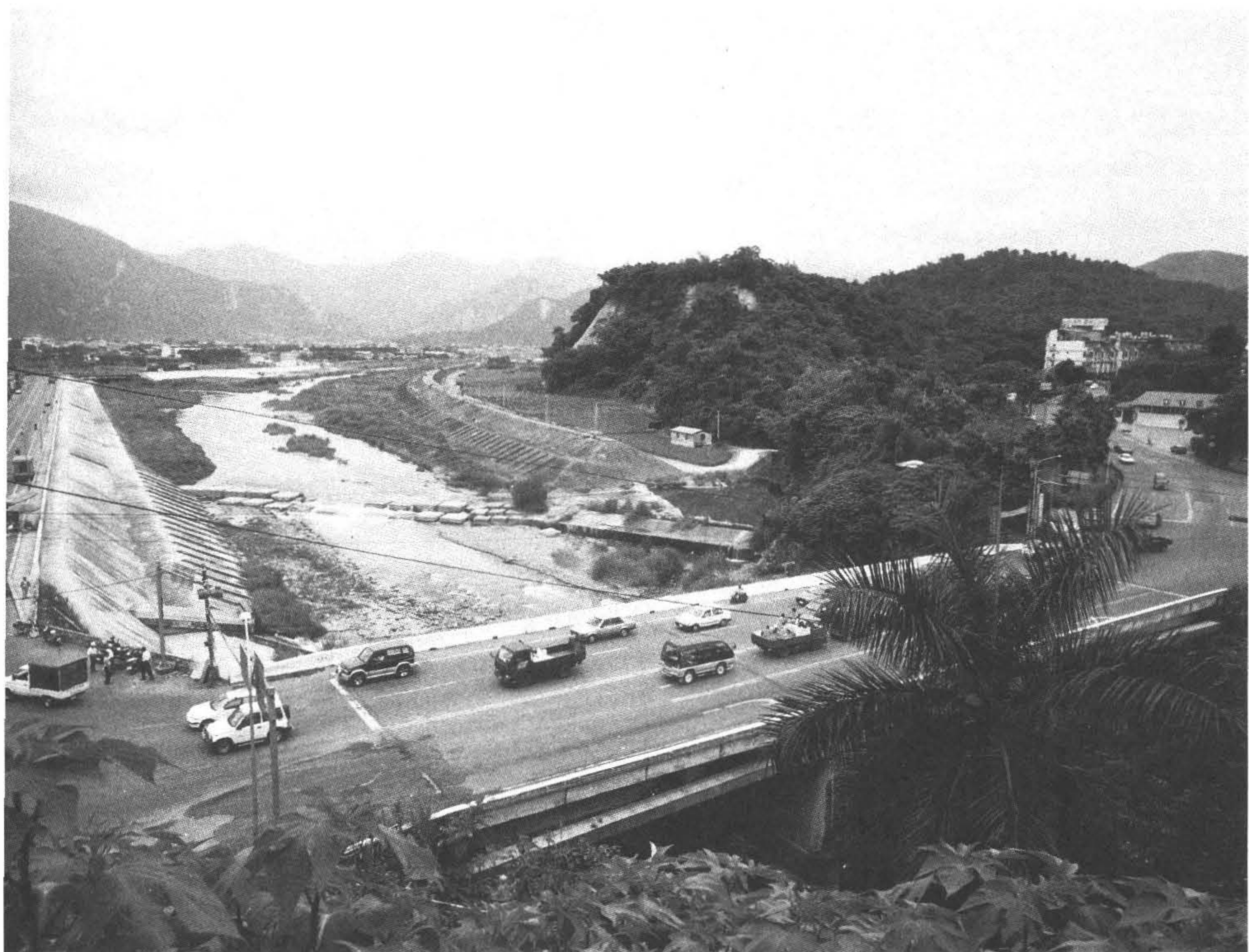
◆南港溪源於南投縣魚池鄉，埔里市區交通要道愛蘭橋兩側，曾是二二八事變的最後戰役「烏牛欄之役」的發生地。（攝於南投縣埔里鎮）