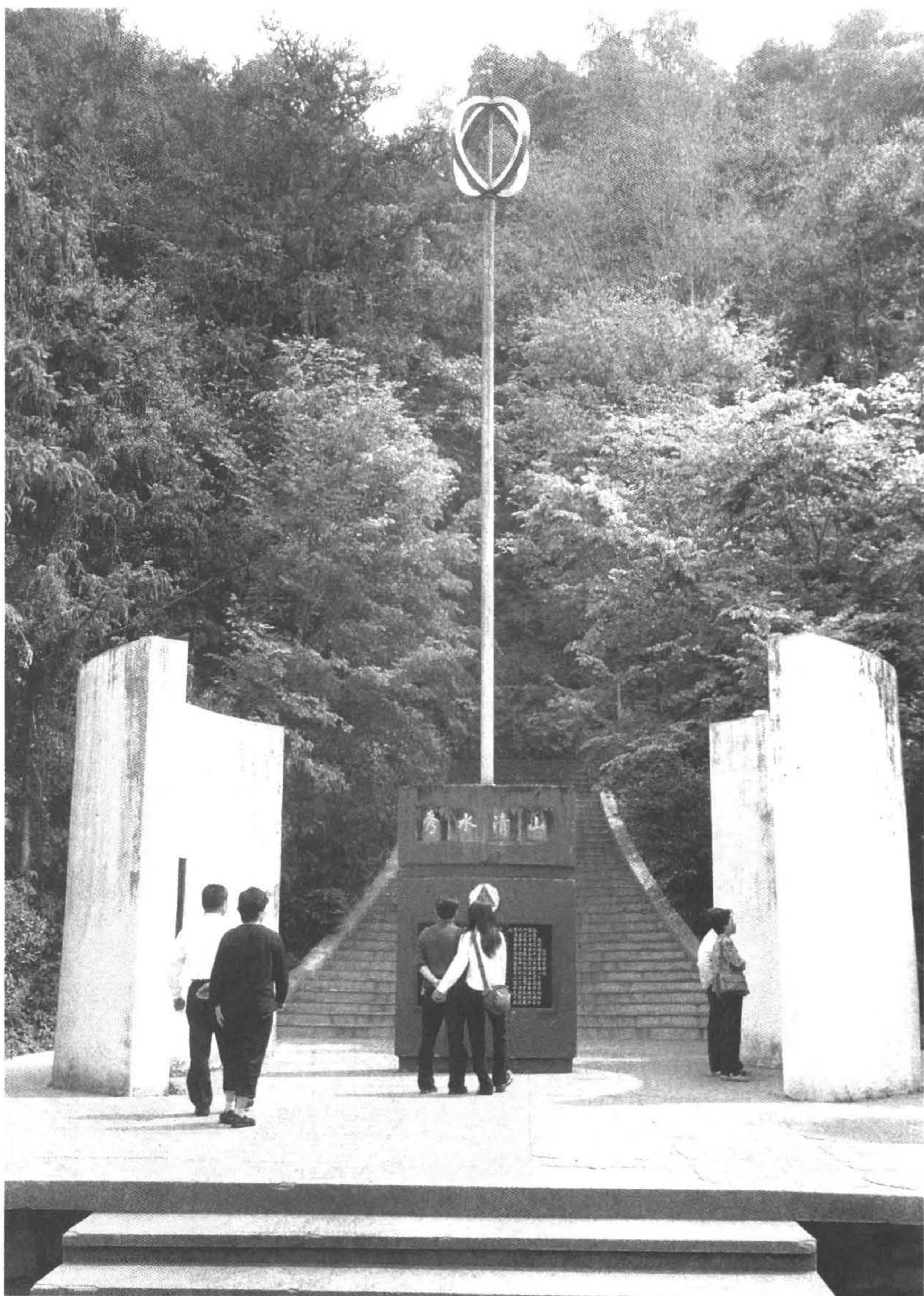
◆台灣地理中心碑位於埔里鎮東北方的虎頭山下，桿上豎一不鏽鋼長柱綴以交叉雙環，是埔里的旅遊地標。 (攝於南投縣埔里鎮)