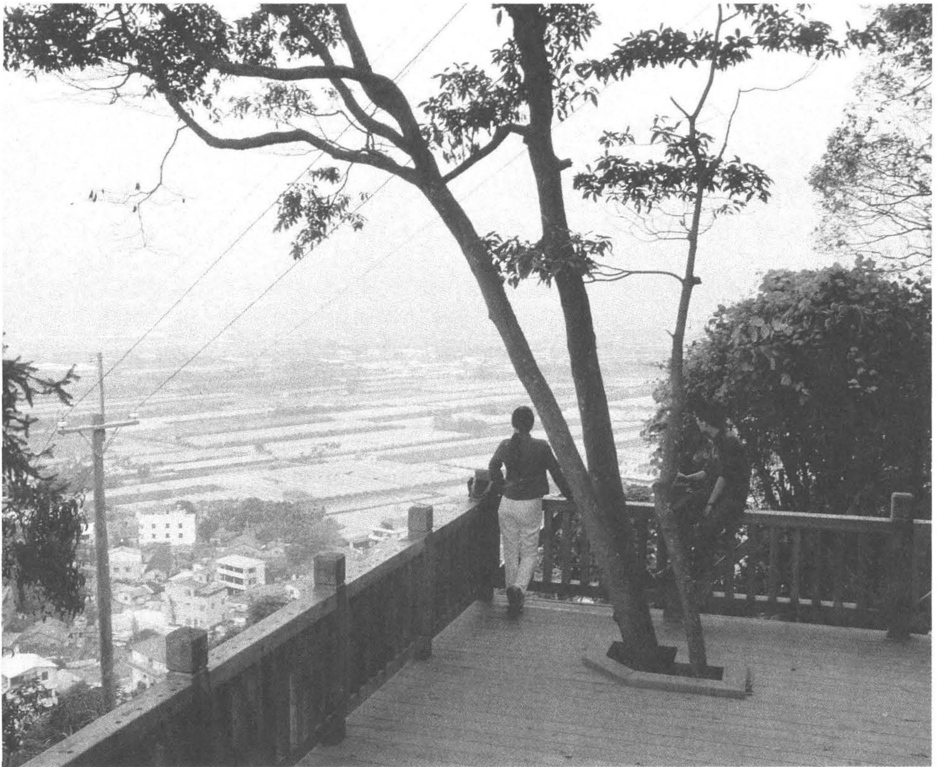
◆埔里舊名大埔城，四面環山 是一盆地地形，盆地海拔約四 百五十公尺。（攝於南投縣埔 里鎮）