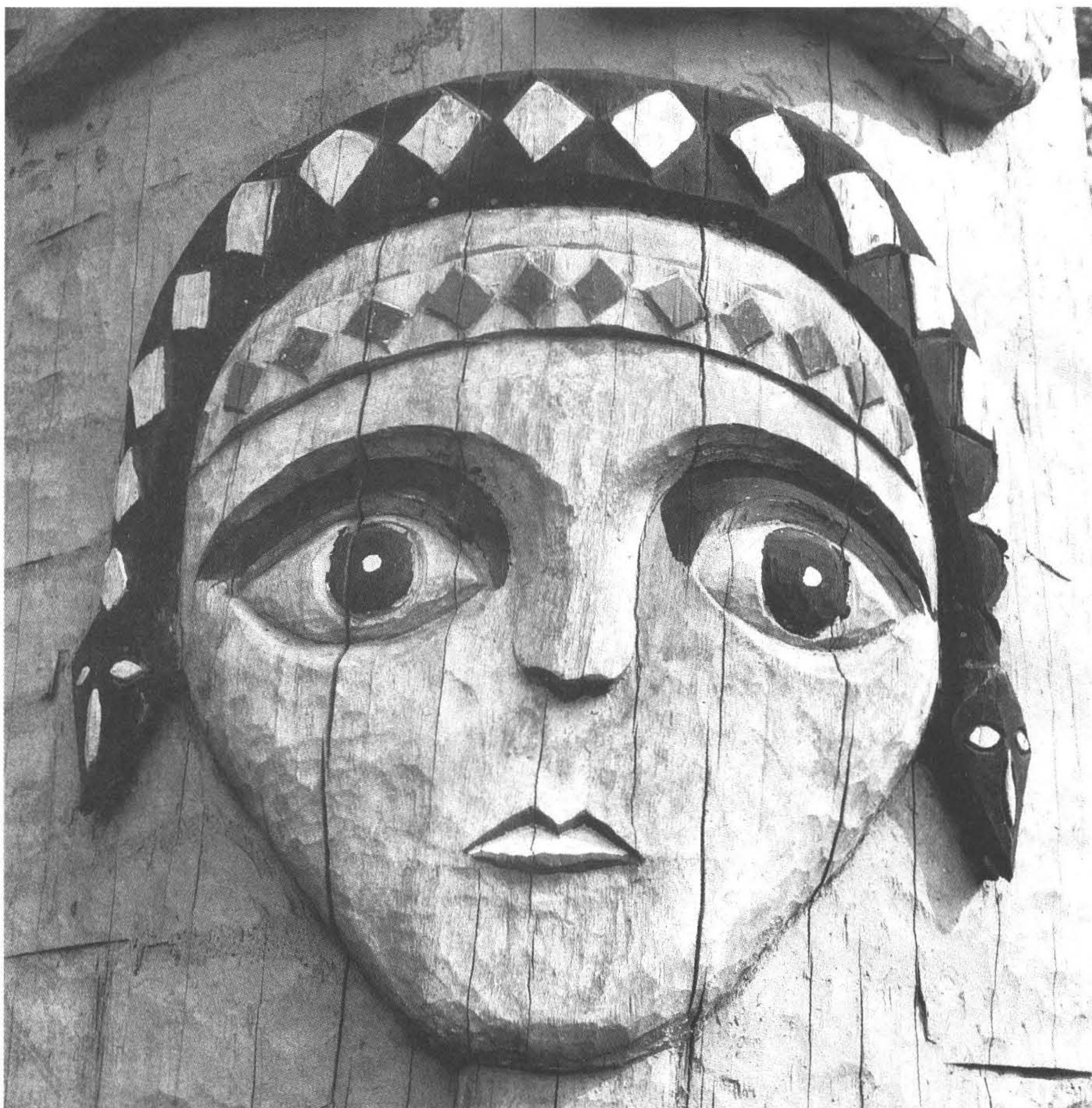
◆泰雅族居住在橫跨台北、桃園、新竹、台中、南投、宜蘭六縣三百至一千五百公尺的山地，共有二十五族群。（攝於南投縣國姓鄉）