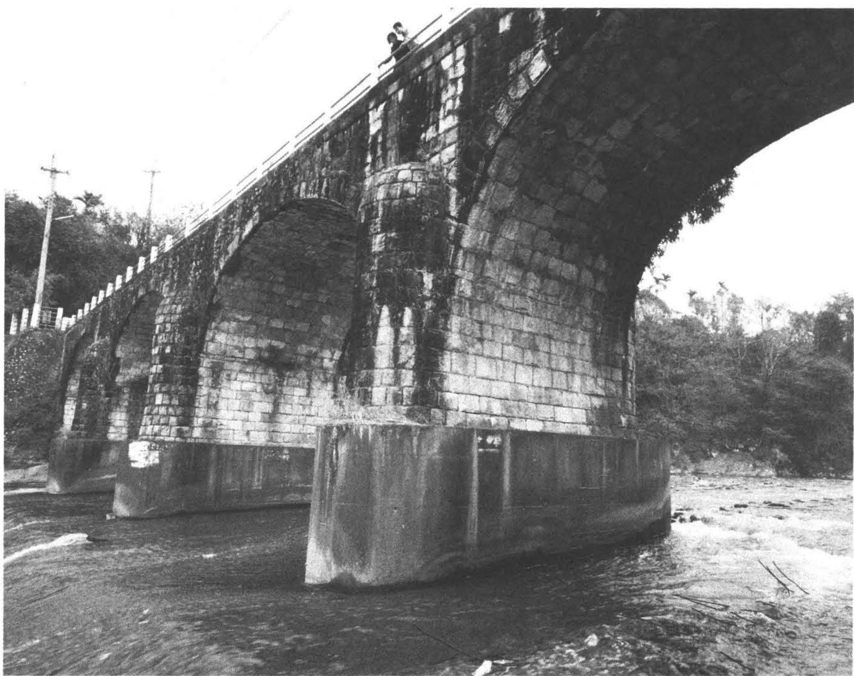
◆北港溪糯米橋寬約五公尺，橋基由三座橢圓橋支撐橋面，形成四孔之拱橋，造型雄偉典雅，極具藝術之美。（攝於南投縣國姓鄉）