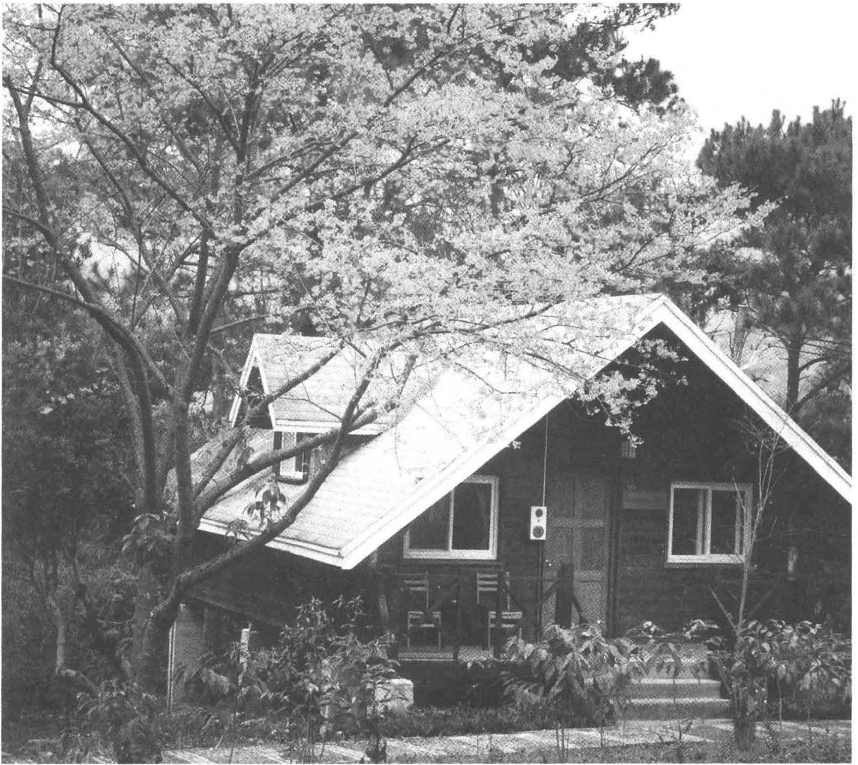
◆美麗的櫻花為惠蓀林場的 冬天增添不少姿色。(攝於 南投縣仁愛鄉)