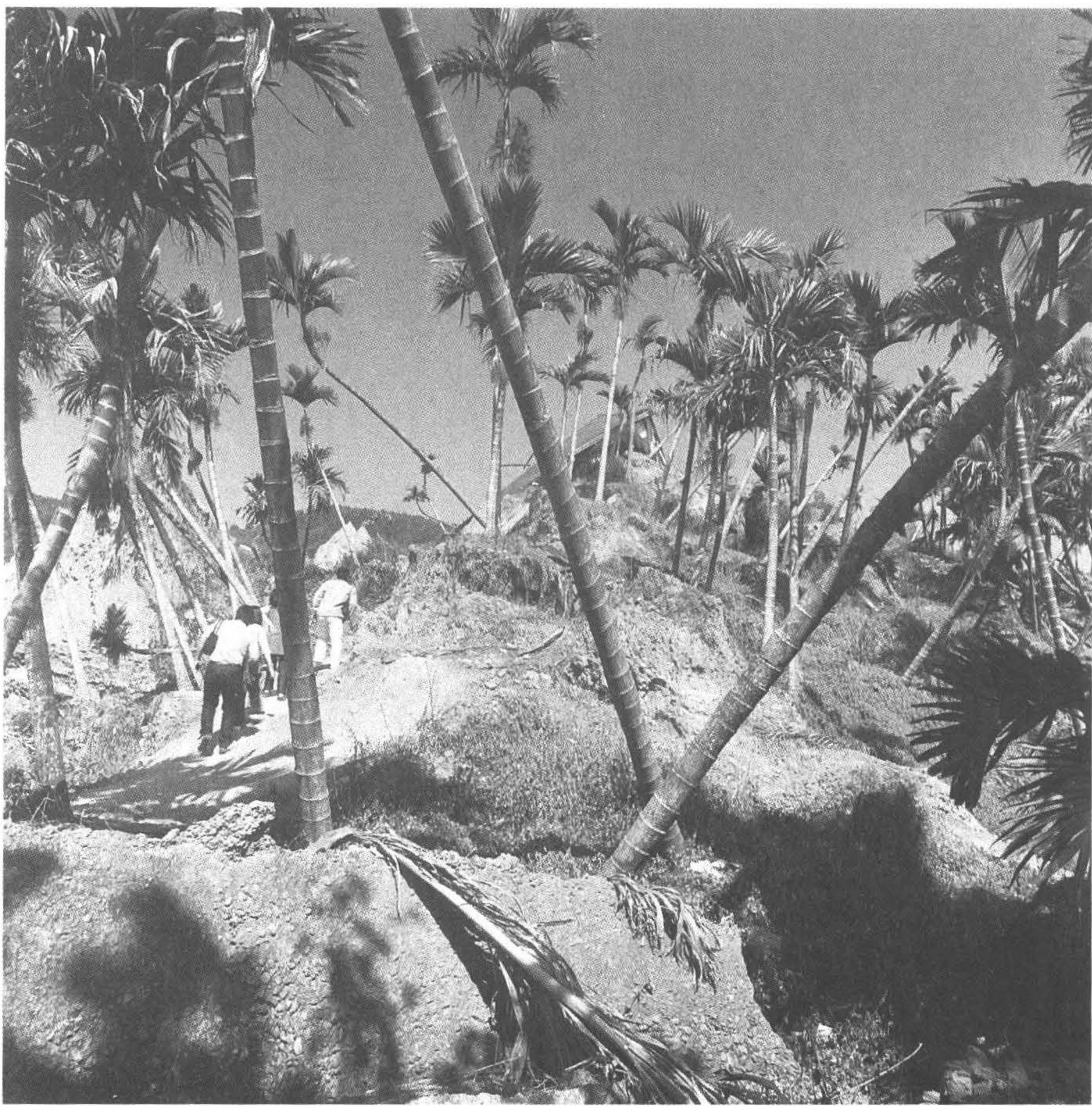
◆一九九九年九二一 大地震，南港村九份 二山是震爆原點，造 成毀滅性的走山，種 植的檳榔樹傾倒滿山 頭。（攝於南投縣國 姓鄉）