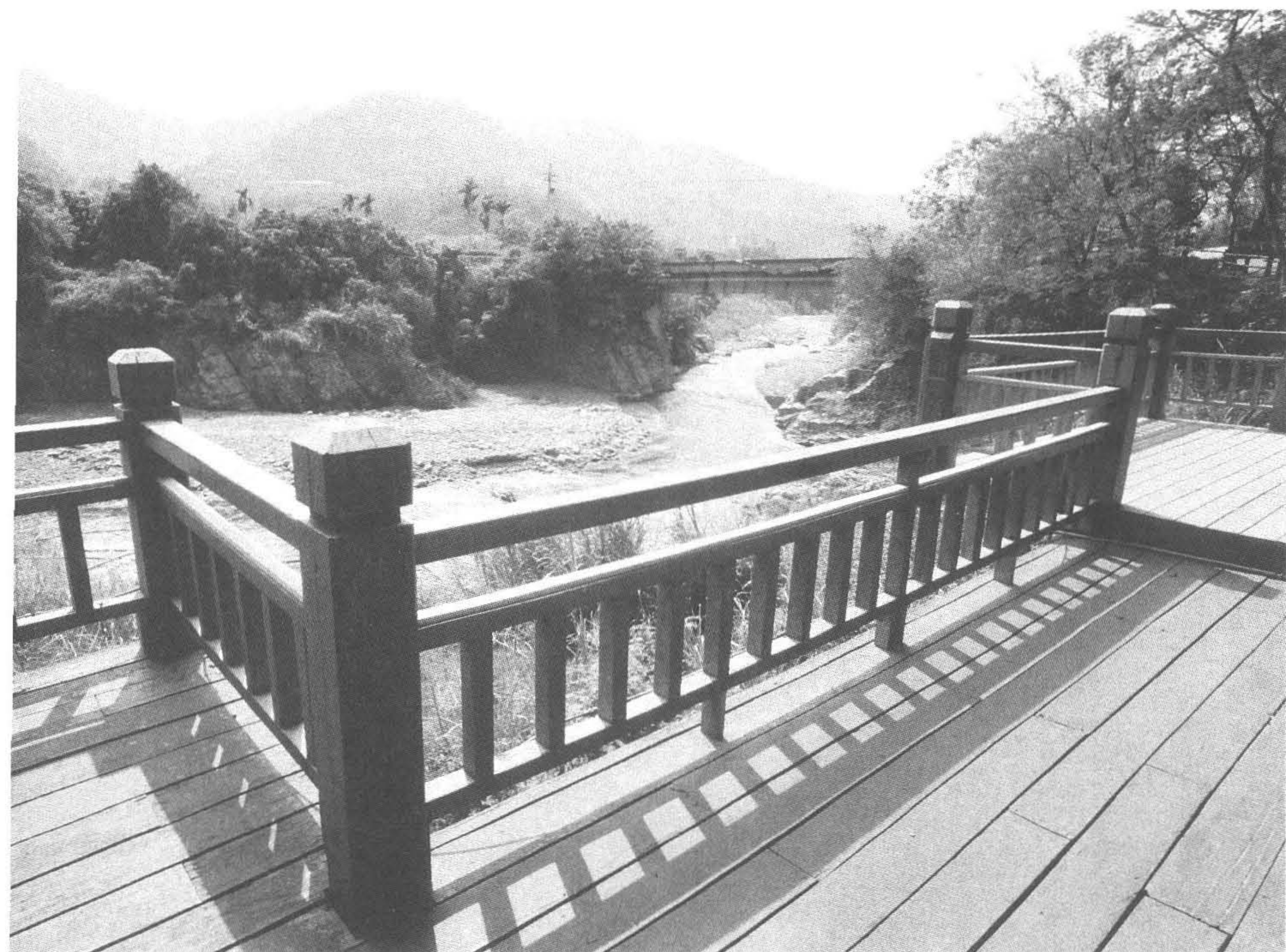
◆北港溪流經北港渡假村附近後，河道蜿蜒度趨小，河水漸呈清澈。（攝於南投縣國姓鄉）