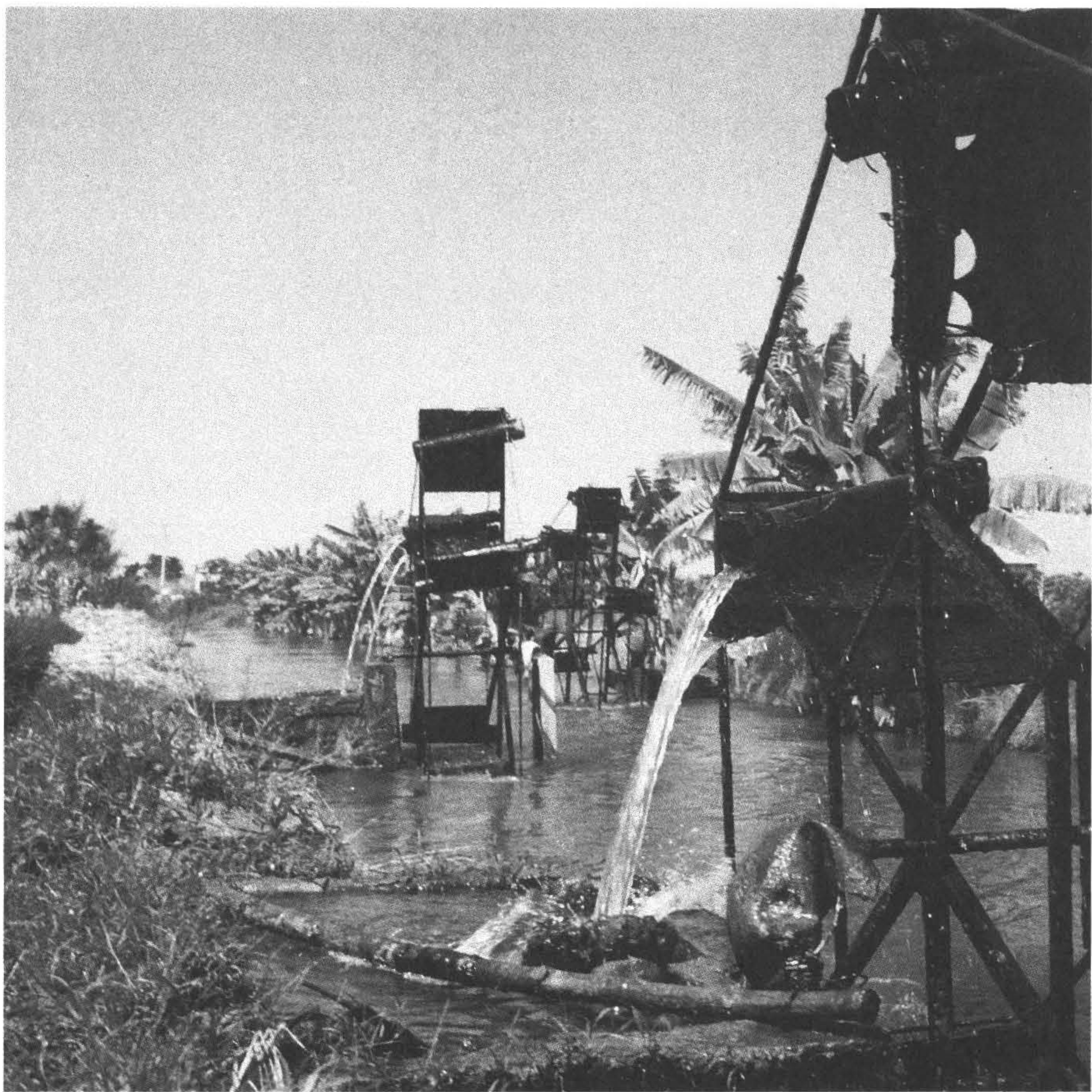
◆烏溪流抵彰化市快官里東邊納入貓羅溪，溪水流經石牌里時，農民以水車汲取河水灌溉農田的特殊景觀，今已不多見。（攝於彰化市石牌里）