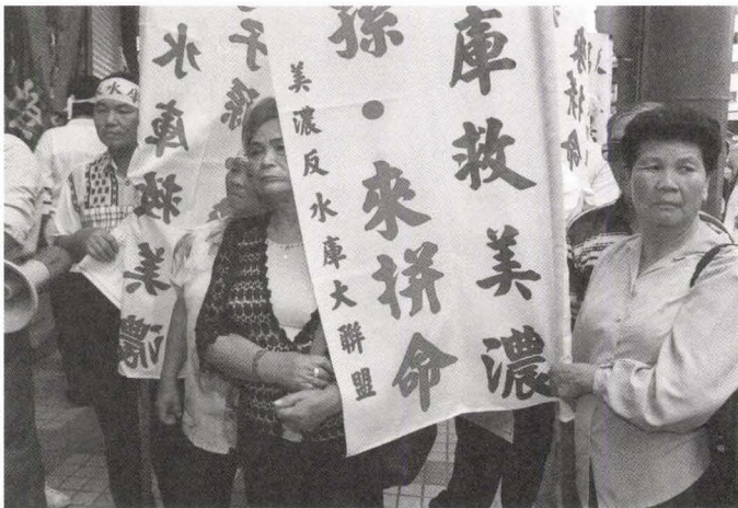
←1996年6月15日 美濃鄉親參加濱南 案環評，抗議政府 為了濱南開發案， 興建美濃水庫。提 供／中時報系

依據燁隆集團的《濱南工業區開發計畫——精緻一貫作業鋼廠與工業專用港環境影響說明書定稿本》第I-D-1頁～第I-D-13頁，大煉鋼廠的用水計畫為：每日循環用水量397萬噸，經過用水的循環使用及引用海水作為動力工廠的冷卻用水，每日所需的補充水量為10.7萬噸，其回收水率高達97%，遠超過中鋼公司及日本新日鐵君津製鐵所，加上廠區每日1.28