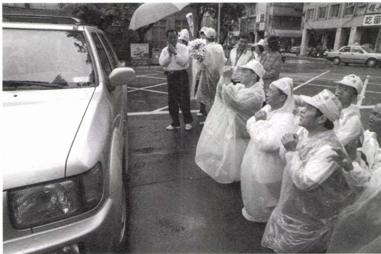
1999年5月28日美濃反水庫鄉親在立法院門口跪求立委刪除美濃水庫預算。

經濟部爲了化解這些不確定性，把美濃水庫先期工程計畫經費二億四千萬編入1999年度總預算，5月28日進入立法院聯席會審查，至當晚九點多，歷經三次表決與歷時三小時的協商，無奈在第四次表決時以95：83通過美濃水庫先期工程預算。夜空下，我們和前來聲援的中華電信工會員工一起隔著圍牆向立法院鳴喇叭表達憤怒！