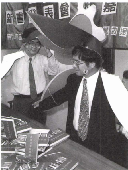
↑1997年12月19日針對第二階段環評發表「黑面琵鷺的鄉愁」。

1997年12月30日，經濟部工業局依《環境影響評估法》第十三條規定，將開發單位編製的濱南案環評報告書（初稿）以及工業局於1997年12月8、9日辦理的現場勘察及聽證會記錄函送給環保署，經環保署初審後，於1998年2月9日函請開發單位補正資料，並請其依環境影響評估書件審查收費辦法繳交審查費。