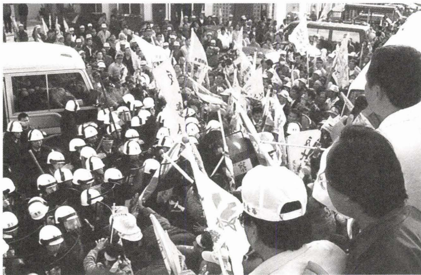
1997年12月8日經濟部辦理濱南案現勘，反濱南人士靜坐與警方對峙。