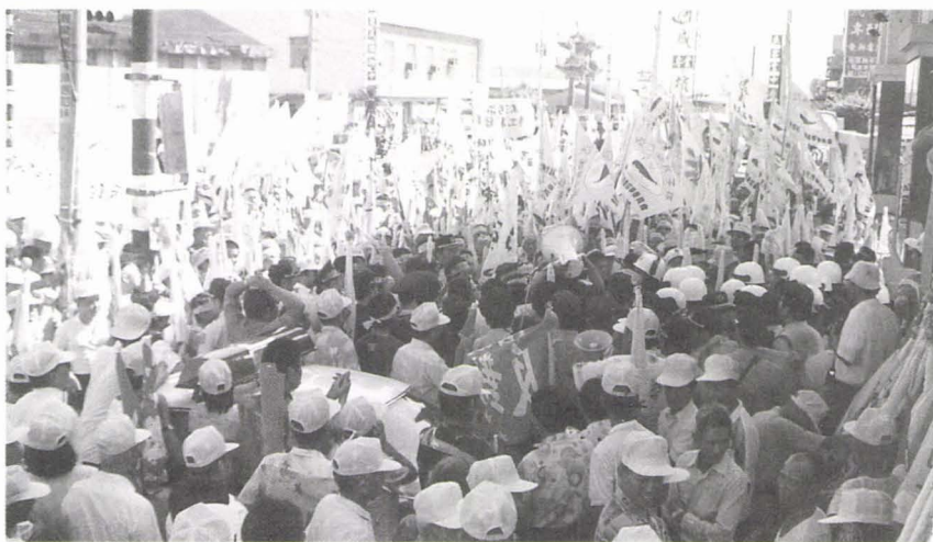
↑ 1996年8月20日開發單位在七股昭明國中舉辦環境影響說明書說明會(場外)。

1996年8月20日上午，開發單位依《環境影響評估法》第八條規定，在七股鄉昭明國中舉行「濱南工業區開發計畫石化綜合廠、精緻一貫作業鋼廠暨工業專用港替代方案環境影響說明書說明會」。由於說明會的舉辦日期，緊跟在八天七夜的「愛鄉土·反七輕·南瀛苦行」之後，稍早前，贊成濱南案的「大七股地區整體規劃與開發住民權益促進會」頻頻放話要抵制南瀛苦行，使得這場在南瀛苦行之後舉行的說明會變得十分詭異，加上警方人馬的大調動，為這場說明會增添幾許緊張氣氛。