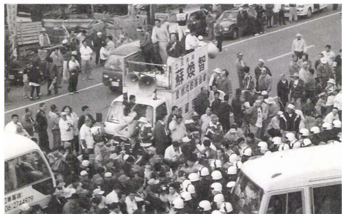
1997年12月8日經濟部辦理濱南案現勘，反濱南人士靜坐與警方對峙。