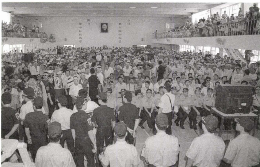
↑ 1996年8月20日開發單位在七股昭明國中學辦環境影響說明書說明會(場內)。

說明會場內外，反對與贊成的雙方人馬相互較勁，反對的一方頻頻向贊成者喊話，要求贊成者脫下黃色帽子加入反對陣容（當天贊成者係以戴黃色帽子作為識別），形成氣勢上的強烈對比。