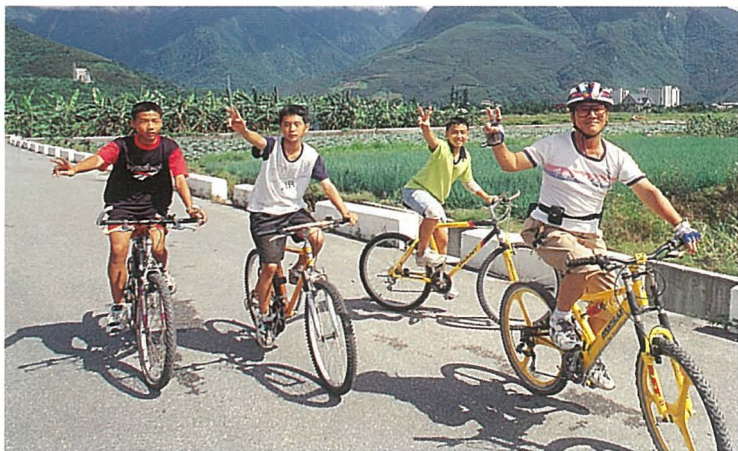
● 吉安溪上游處處都是平曠綠野的景色。

見這般畫面，直叫人欣喜萬分。其實，只要國人愛惜、守法，這樣悠閒的畫面，在台灣不也可以隨處可見？