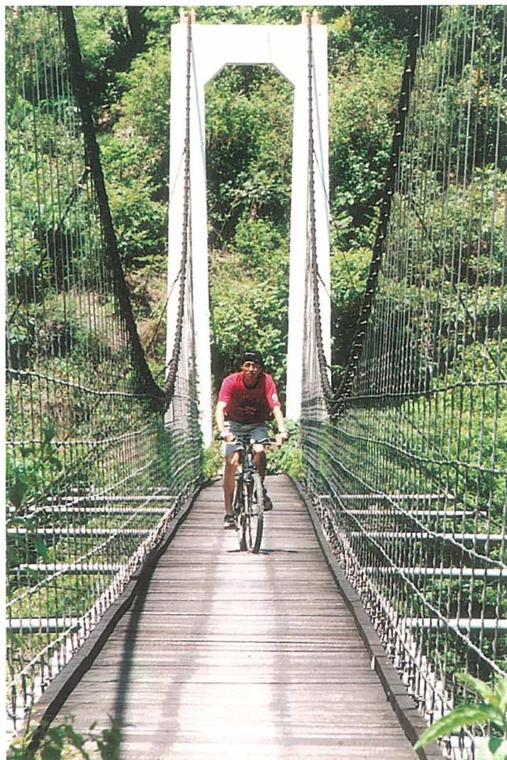
● 靜靜跨越山谷的吊橋，形制優美。