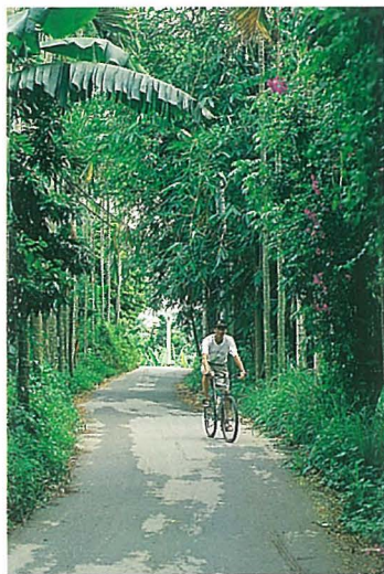
● 檳榔、竹林夾道的蜿蜒山徑，清風徐徐、蝶影翩翩。

過聚落之後，可往區運會的飛靶射擊場方向下至溪床，高度過肩的草叢中鋪設了簡易的路面，穿行其間，頗有牧野