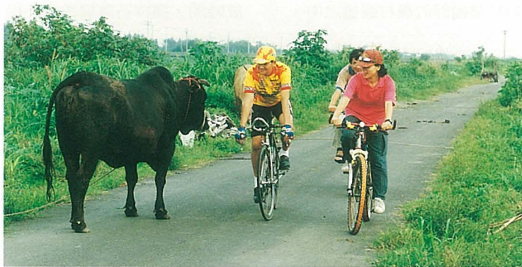
● 老牛相伴的鄉間小徑，踩踏其間格外悠閒。