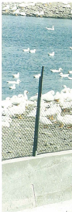
●雪白鴨群 點綴出遊程 中特殊的沉 味。