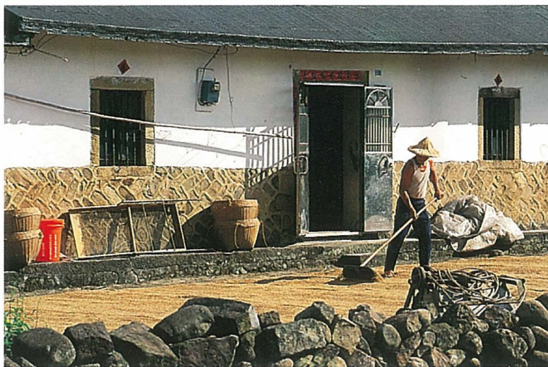
●雙溪一帶還保持著傳統農村生活的樣貌。

車友，或家庭組合的車友，雙溪村往西沿平林溪的「雙柑公路」或往東沿雙溪河的一〇二縣道以及隔岸的北三八鄉道，倒是一條相當適宜的郊遊型路線。