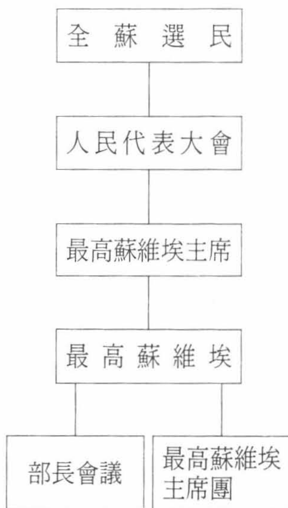
圖二：蘇聯設立人民代表大會之後的最高權力結構

—— 領導制定議案，以便提交蘇聯人代會與最高蘇維埃審議；簽署人代會、最高蘇維埃及最高蘇維埃主席團所通過的法律或其他法案；