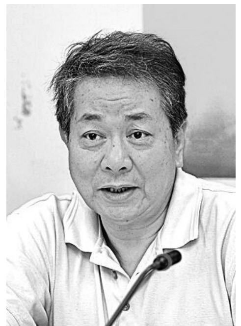
◆河川環境小組於幼華顧問。