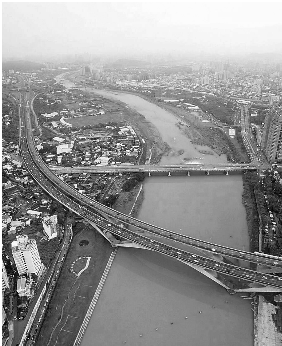
◆水質改善後的淡水河，其蜿蜒的河道魅力無窮。

在過去二十年間，積極針對水污染來源的市鎮污水、事業廢水、畜牧廢水及垃圾滲出水的源頭削減，雖然其間人口持續增加，各種生產活動仍迅