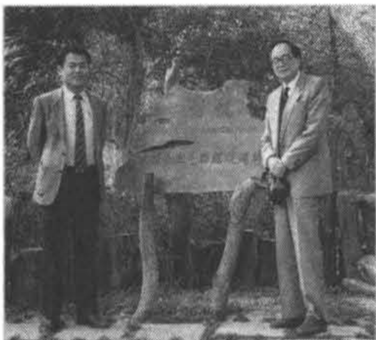
1992年參觀金門蔣故總統手植楓樹