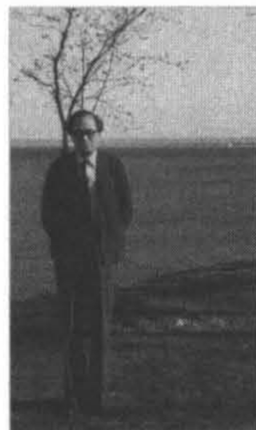
1982年在上海市主持一項世界衛生組織研討會時演講