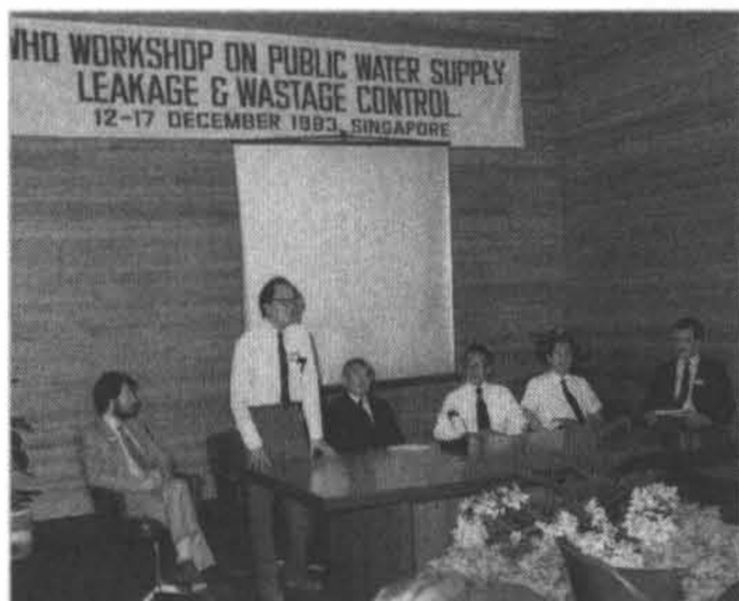
1983年在新加坡主持世界衛生組織為區域性漏水控制研討會