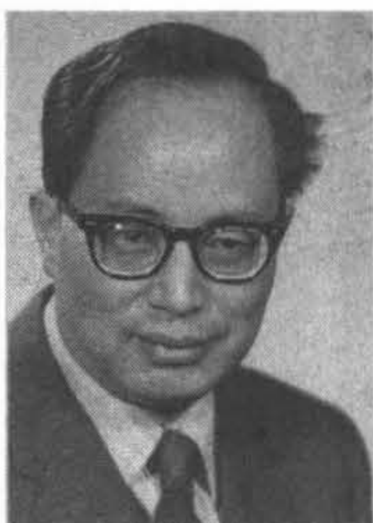
1972年任職聯合國世界衛生組織