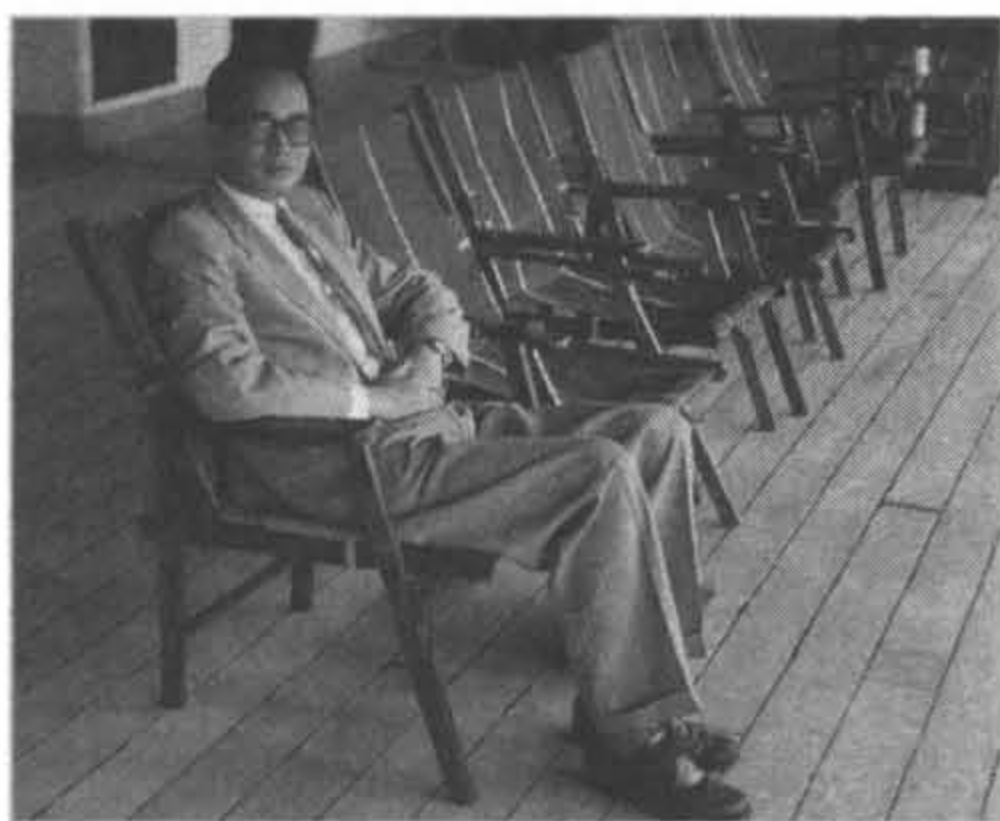
1960年自澳洲雪梨搭船至紐西蘭任職

1959 應聘赴澳洲雪梨University of New South Wales擔任研