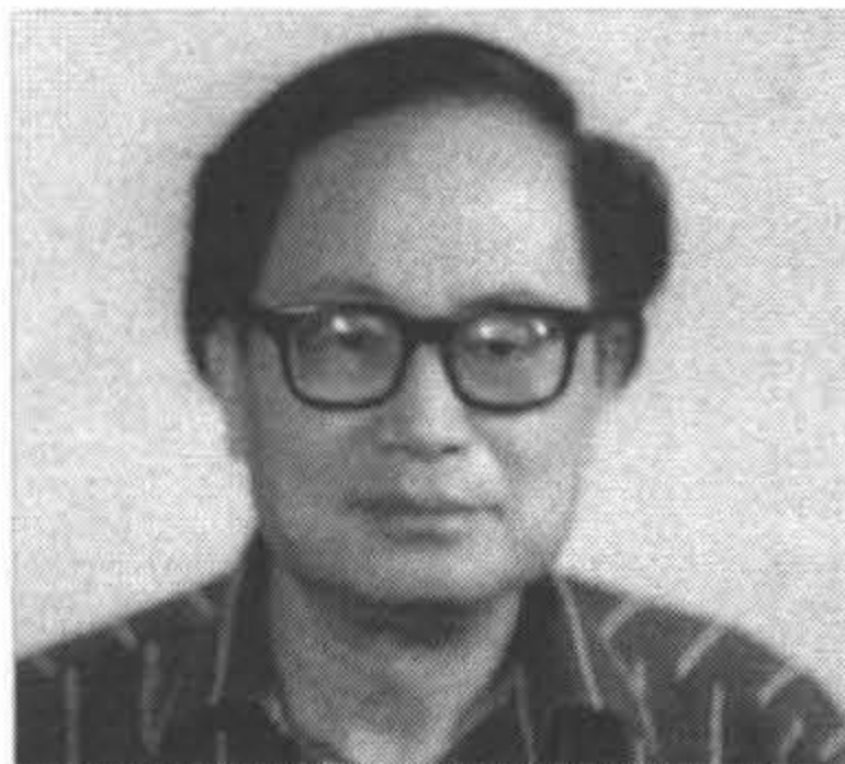
1985年返台任台灣省政府住宅及都市發展局顧問