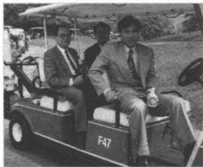
1987年任行政院環境保護小組專家委員視察高爾夫球場