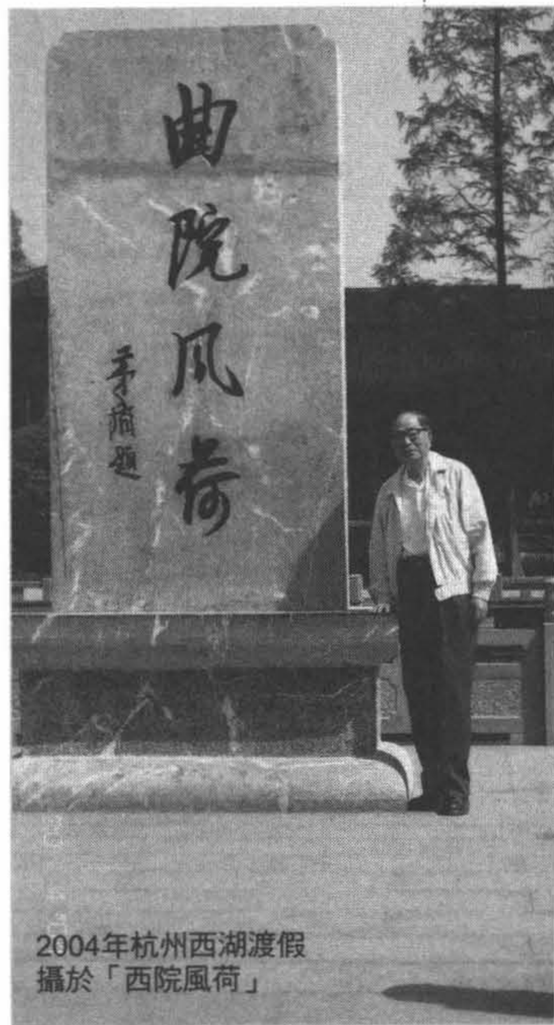
2004年杭州西湖渡假 攝於「西院風荷」