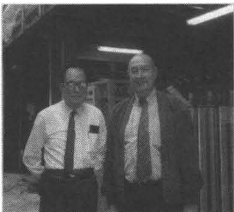
1993年參觀法國巴黎自來水處理廠