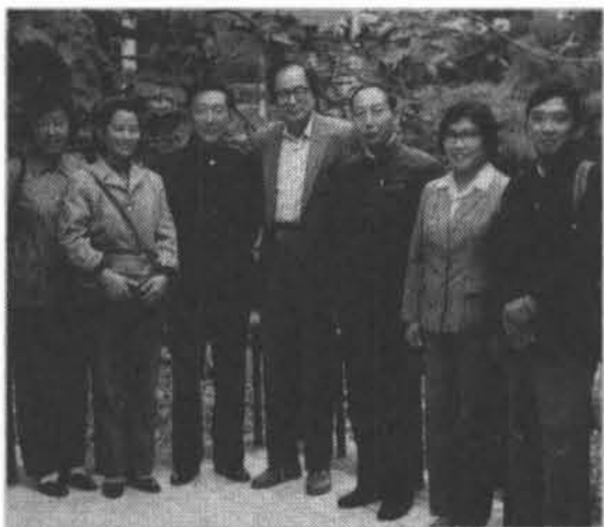
1985年廣州西樵山主持一項世衛組織研討會與大陸參與同仁合影