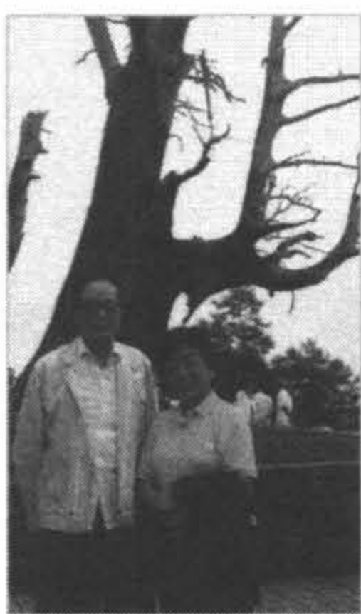
1999年度台灣自來水百週年紀念大會貴賓