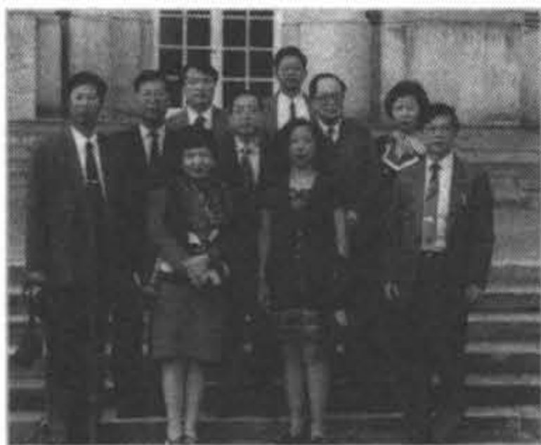
1993年帶同金門縣同仁參觀德國上下水道