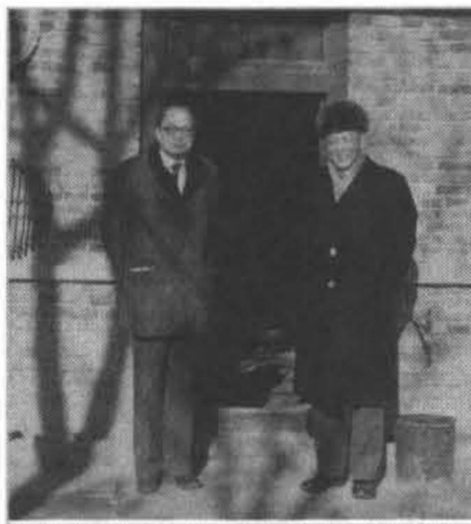
1979年參觀北京市近郊農村生活