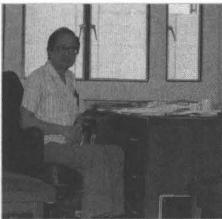
1979年任職聯合國世界衛生組織西太平洋區環境規畫中心