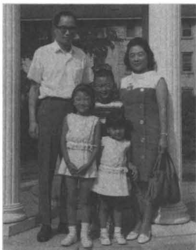
1967年在美國北卡羅林那大學校園全家合攝